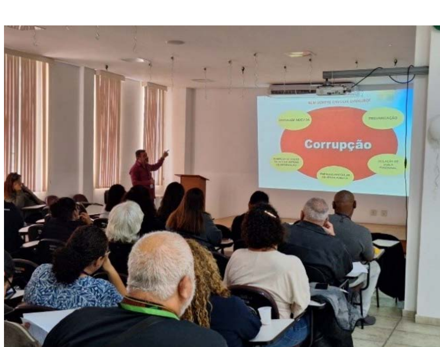
Foto: Palestra realizada na DRCAP.

Essas ações tiveram início em setembro de 2024, os primeiros locais visitados foram a DRMC e a DRCAP. Outras ações estão previstas a partir de março com o objetivo de visitar e promover a cultura de integridade em todas as regionais, assim como realizar ações também junto aos servidores dos Centros de Atendimento.